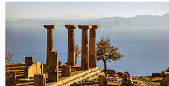
Assos Antik Kenti