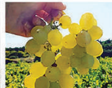
Bozcaada Çavuş Üzümü