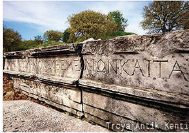
Truva Antik Kenti