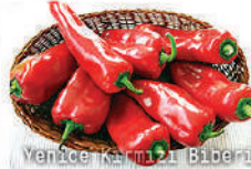
Venice Kırmızı Biberi